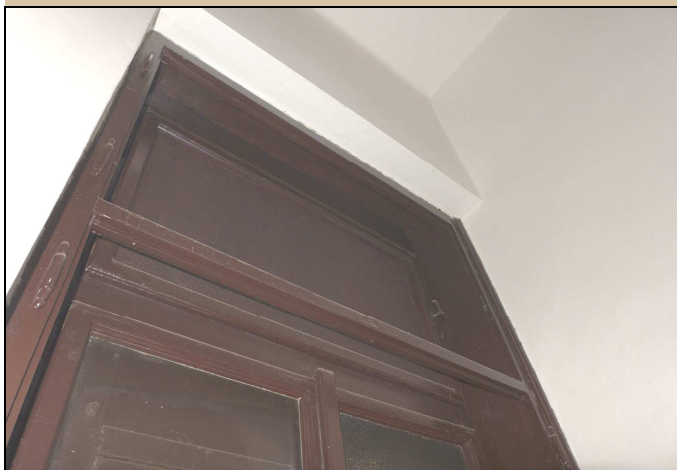
Horní část okna – pohled z interiéru