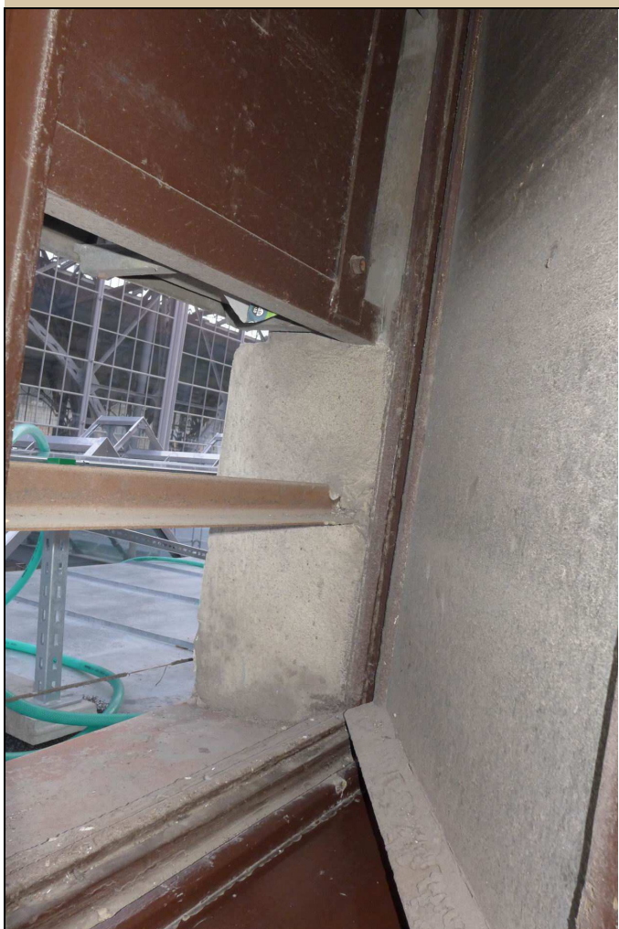
Pohled do okna s rozvaděčem