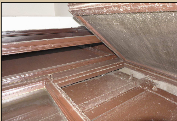
Pohled na horní stranu okna